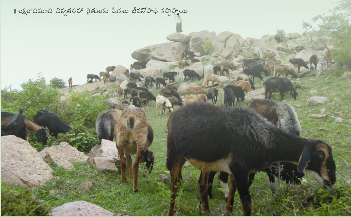
■ లక్షలాదిమంది చిన్నతరహా రైతులకు మేకలు జీవనోపాధి కల్పిస్తాయి

ఆంగ్ల మూలం: లీసా ఇండియా సంపుటి 12, సంచిక 1 , మార్చి, 2010