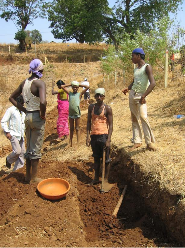
■ ఈనెగట్ల వెంట కందకాలను తవ్వడం