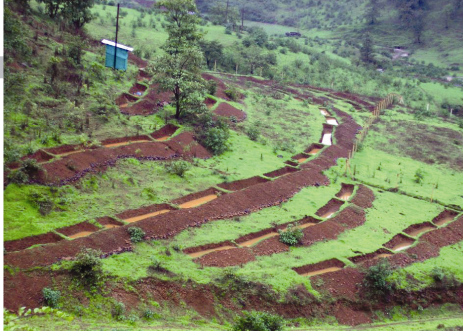
■ ఈనెగట్లు వెంట తీసిన కందకాలలో నిలిచిన వర్షపు నీరు

పతనమైపోయిన జీవావరణాలను మెరుగుపరచడానికి, గ్రామీణ ప్రజలకు వైవిధ్యభరితమైన జీవనోపాధి అవకాశాలను కల్పించడానికి, స్థిరమైన జీవావరణాల నిర్మాణానికి చిన్న తరహా నీటిపరీవాహక ప్రాంతాల అభివృద్ధి ఒక చక్కని మార్గం. ఈ విషయాన్ని మహారాష్ట్ర లోని గిరిజన గ్రామాలకు చెందిన 14 ఎకరాల ప్రాంతంలో నిరూపించి చూపించింది అసీమా ట్రస్టు.