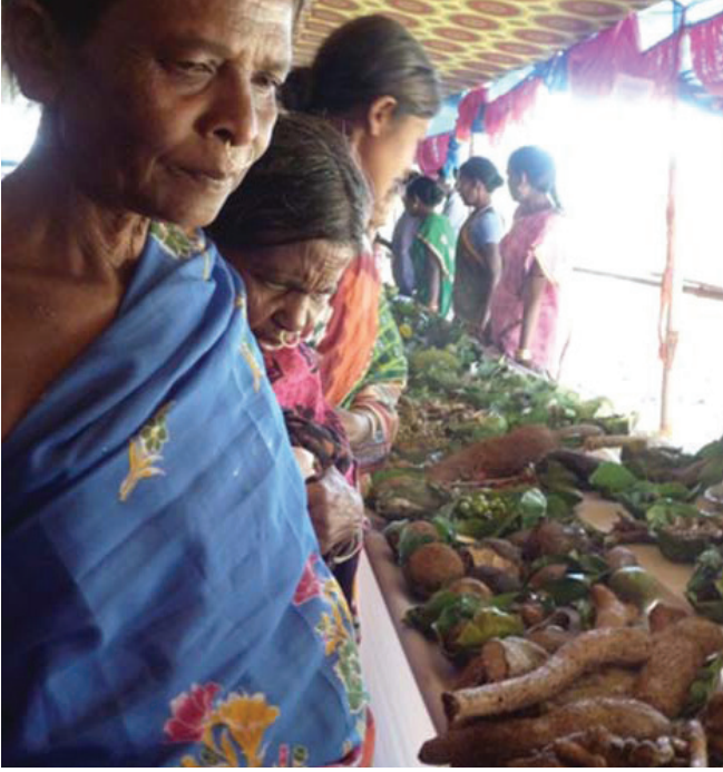
గిరిజనులు ప్రదర్శనకు ఉంచిన అనేకరకాల అటవీ ఆహారాలు

మీద 80,000 వరకూ ఉన్నట్లు 'గైయా అట్లాస్ ఆఫ్ ప్లానెట్ మేనేజ్మెంట్' పేర్కొంది. కానీ కేవలం 150 మొక్కలే అనాదిగా ఆహారపంటలుగా పండించడం జరుగుతోంది. అయితే పారిశ్రామిక పద్ధతులే పండించే ఏక పంట విధానాలు అమలులోకి వచ్చేసరికి ఈ సంఖ్య 20కి పడిపోయింది. మొత్తం మానవుల ఆహారంలో 90% కేవలం ఈ 20 మొక్కలే అందిస్తున్నాయి. మొత్తం మానవులకు అందే ఆహారంలో నాలుగింట మూడవ వంతు ఒక ఎనిమిది పంటల నుండే వస్తోంది. ప్రకృతి మనకు ప్రసాదించిన తినడానికి యోగ్యమైన వృక్ష సంపదలో ఇది 0.01%, అంటే 10 వేలలో ఒక వంతు. దీనిని బట్టి చూస్తే, అందమైన రంగురంగుల ప్యాకెట్లలో వినియోగదారులకు విక్రయిస్తున్న మల్టీ-బ్రాండ్ ఉత్పత్తులను ప్రోత్సహించే ఆర్థిక వ్యవస్థలో మనం నిజంగా ఎదుగుతున్నామా లేదా మరింత లేనివాళ్ళం అవుతున్నామా?