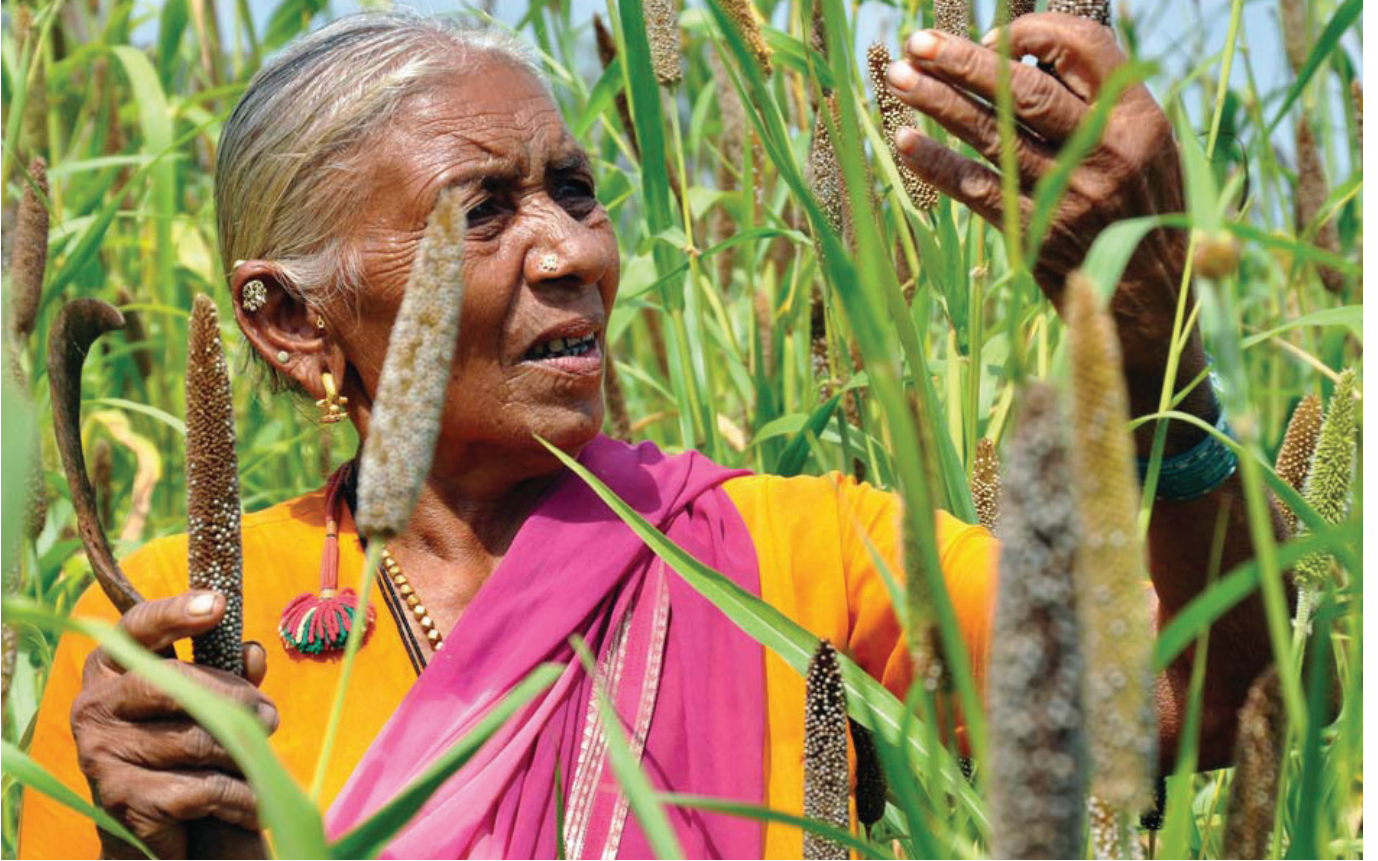
విత్తనాల ఎంపికకు బనంచ్‌పూర్ సర్పస్సు వంటి స్త్రీలకు ఉన్నలాంటి గొప్ప పరిజ్ఞానం కావాలి

కలకలలాడుతోందంటే కారణం, సాటిలేని ఈ మేటి 'ఫార్మ్-టు-కిచెన్' (పొలం - నుండి - వంటింటికి) అన్న నమూనాయే! ఈ ఆహారపు సాంప్రదాయాన్ని కాపాడుకుంటూ వస్తున్నది ముఖ్యంగా మహిళలే కాబట్టి, ఈ వ్యవసాయ జీవవైవిధ్య సాంప్రదాయానికి కూడా వారసులు వీరే.