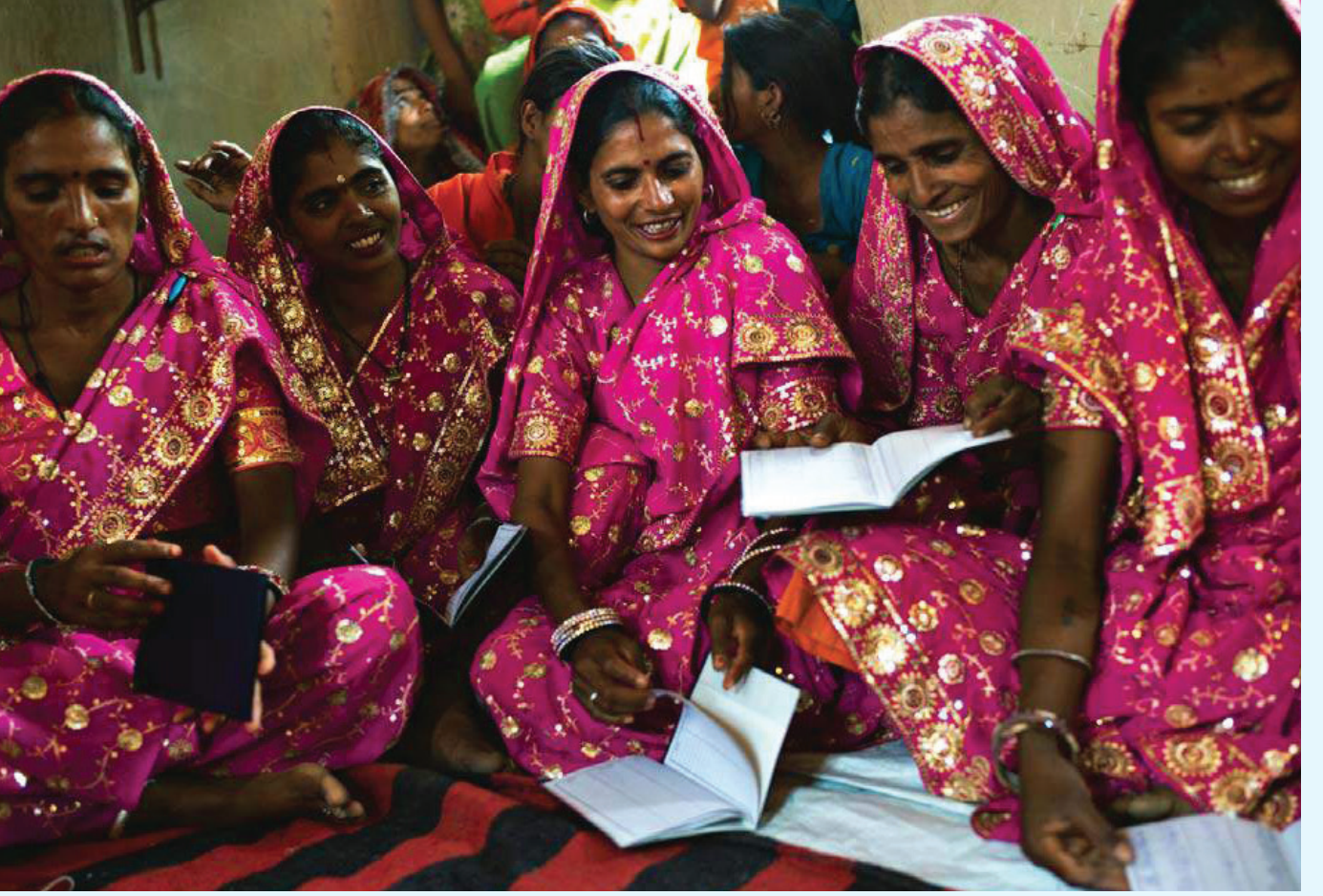
ఒకరితో ఒకరు మాట్లాడుకోవడానికి, ఒకరికి ఒకరు తోడ్పాటునందించుకోవడానికీ ఎస్.హెచ్.బి. సమావేశాలు వేదికగా ఉంటాయి