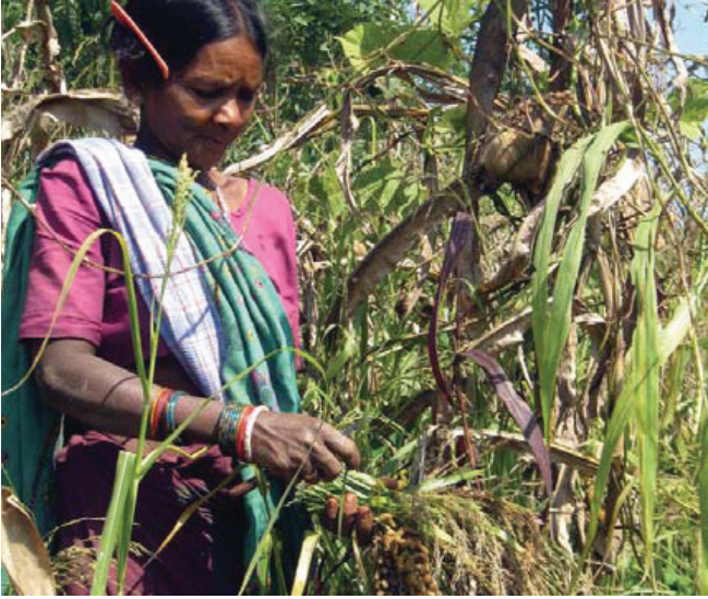
దృఢమైన ఈ చిరుధాన్యాలు నీటి ఎద్దడిని తట్టుకుంటాయి

వ్యవస్థ ప్రధానంగా వరిబియ్యం మీదే దృష్టి పెట్టడంతో రైతులు ఇతర పంటలు వదిలిపెట్టి వరి పంటకు మారిపోయారు. ప్రస్తుతం ఈ ప్రాంతంలో కేవలం ఒక 12-13 రకాల పంటలు మాత్రమే పండిస్తున్నారు.