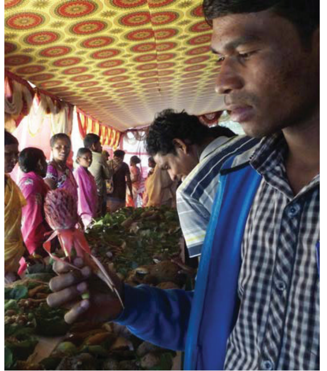
గిరిజన ఉత్సవంలో ప్రదర్శనకు ఉంచిన అటవీ ఆహారాన్ని పరిశీలుస్తున్న సందర్భాలు

వనవాడిలో జరిపిన ప్రాథమిక సర్వేలో అనేకరకాల సాంప్రదాయ ఉపయోగాలు కల 120 వృక్ష జాతులు ఉన్నట్లు తెలిసింది. ఆహారాన్ని అందించే వృక్షాలే కాకుండా ఔషధీయ ఉపయోగాలు కల వృక్ష జాతులు 45కి పైనే ఉన్నట్లు తెలుసుకున్నాము. కలపకు పనికివచ్చే వృక్షజాతులు కనీసం 20దాకా ఉండగా, అందులో నాలుగు ప్రథమ శ్రేణి కలప జాతులుగా పేరున్నవి. వీటితోబాటు అద్దకపు రంగులు, సోపులు, తినడానికి పనికివచ్చే నూనెలు, జీవ-ఇంధనాలు, జిగురు మరియు గుగ్గిలం, జీవ కీటక నాశినులు, విస్తరాలు అందించే వృక్ష జాతులు ఉన్నాయి. అంతేకాక, పశువుల మేత, వంట చెరకు, నార, ఎరువు, కంచె, చేతిపనులు వంటి వాటికి పనికివచ్చే వృక్షాలు కూడా ఉన్నాయి.