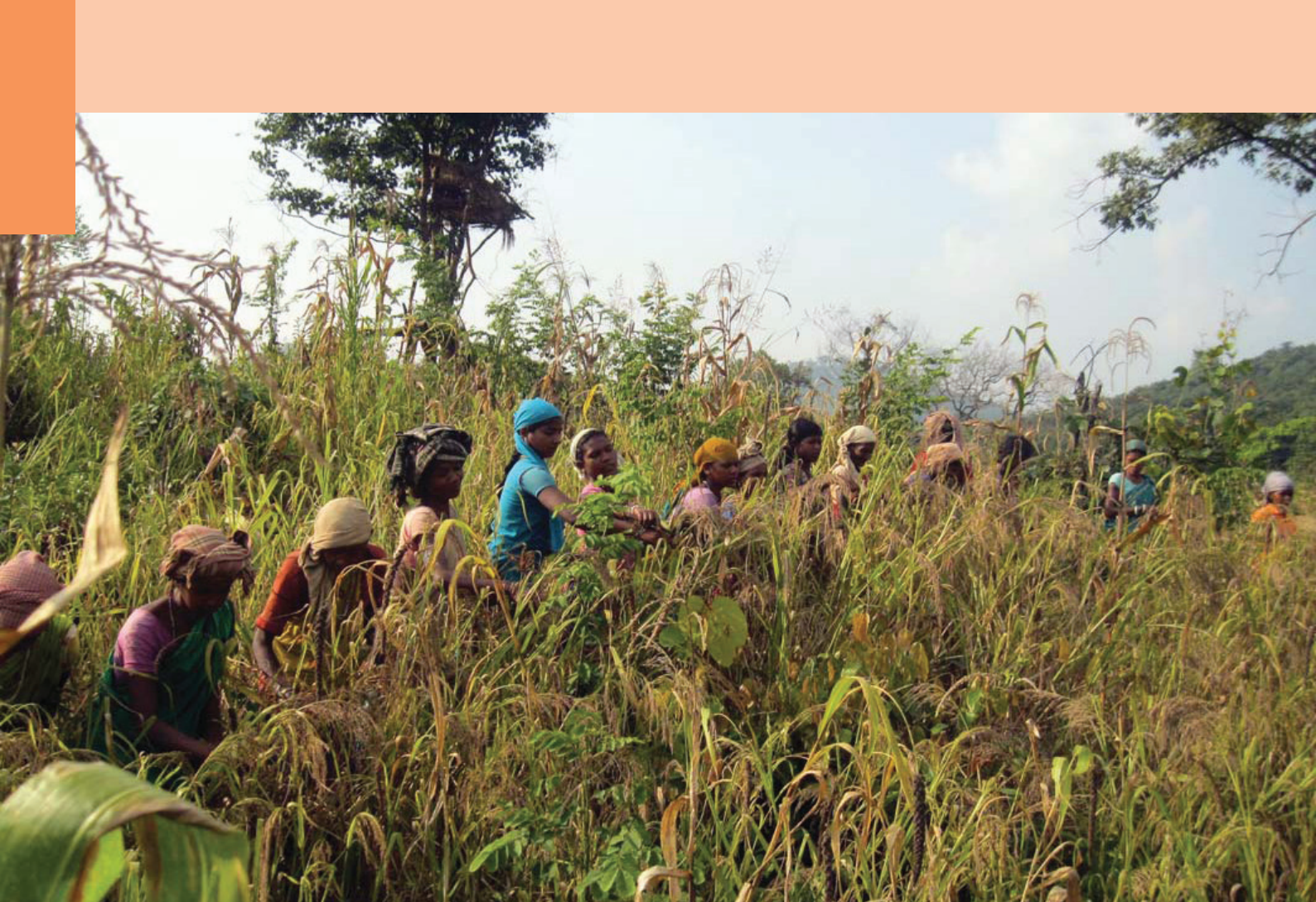
వివిధ రకాల చిరుధాన్య పంటలను కోస్తున్న మహిళలు